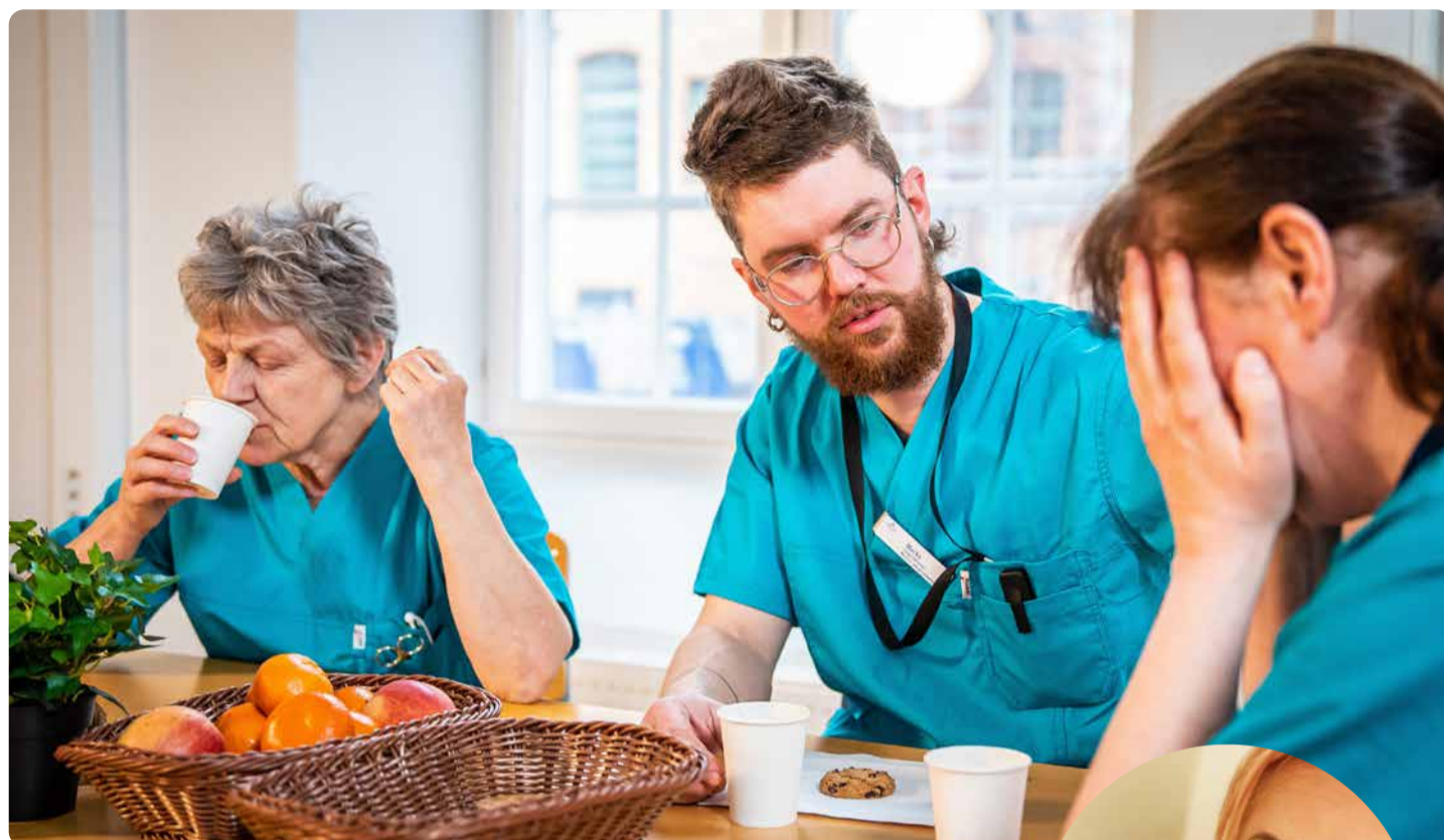
Det räcker inte med applåder. Dom anställda i vården behöver bättre villkor, fler arbets-kamrater och en hållbar arbetsmiljö.

– Det är en stor utgiftspost, men borde ändå vara en självklarhet givet att det är en så tydlig arbetsmiljöfråga. En väldigt stor del av alla arbetsskador är förslitningsskador, vilket ofta är relaterat till avsaknad av arbets-skor. Vi skulle aldrig bestrida en brandman eller polis rätt till lämplig arbetsutrustning, så varför förnekar vi omsorgens arbetare det-samma? Då är det politikens ansvar att gå in. ■